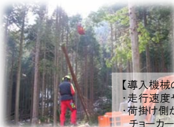
【導入機械のポイント】 ・走行速度や巻き上げ能力の向上 ・荷掛け側からの無線操作やオート ・ジョーカーの併用による作業効率化