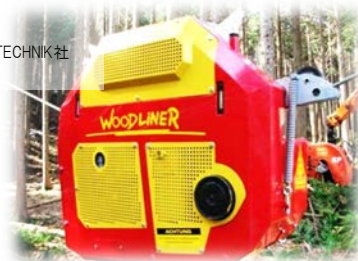
■高性能搬器 【型 式】 WOODLINER2500 【メーカー】 KONRAD FORSTTECHNIK 社 【生産国】 オーストリア

静 岡県森林組合連合会では、昨年度の事業によりオーストリア製の高性能搬器を導入し、新たな作業システムの開発に取り組んでいるところです。 そこで、新たに導入した機械の普及を図り、新たな作業システムの可能性を検討するための現地検討会を開催し、先進林業機械の紹介や新作業システムのデモンストレーションを行います。